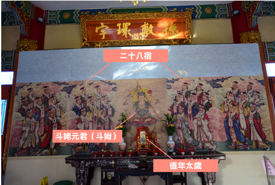
斗姥元君、二十八宿、值年太歲