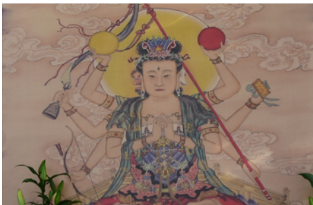
頭門內的斗姆畫像