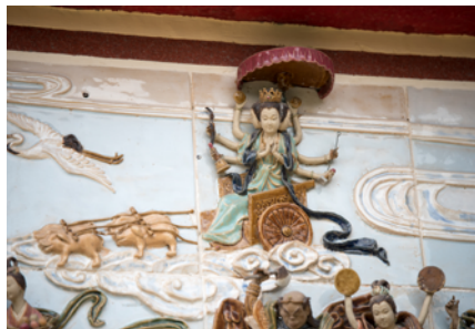
神仙壁畫上的斗姆塑像